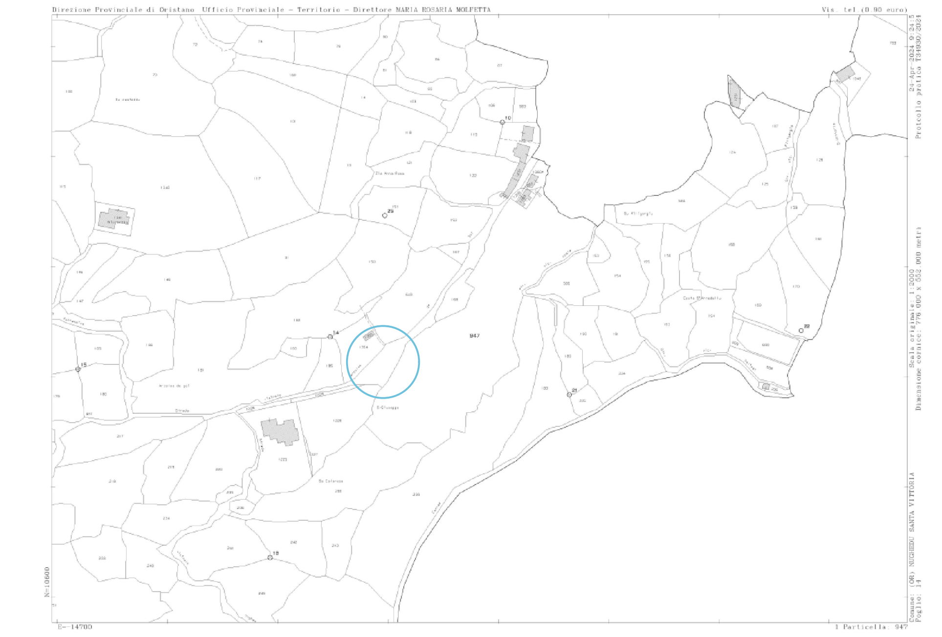
Catastale comune di Nughedu S. Vittoria Stralcio F.14